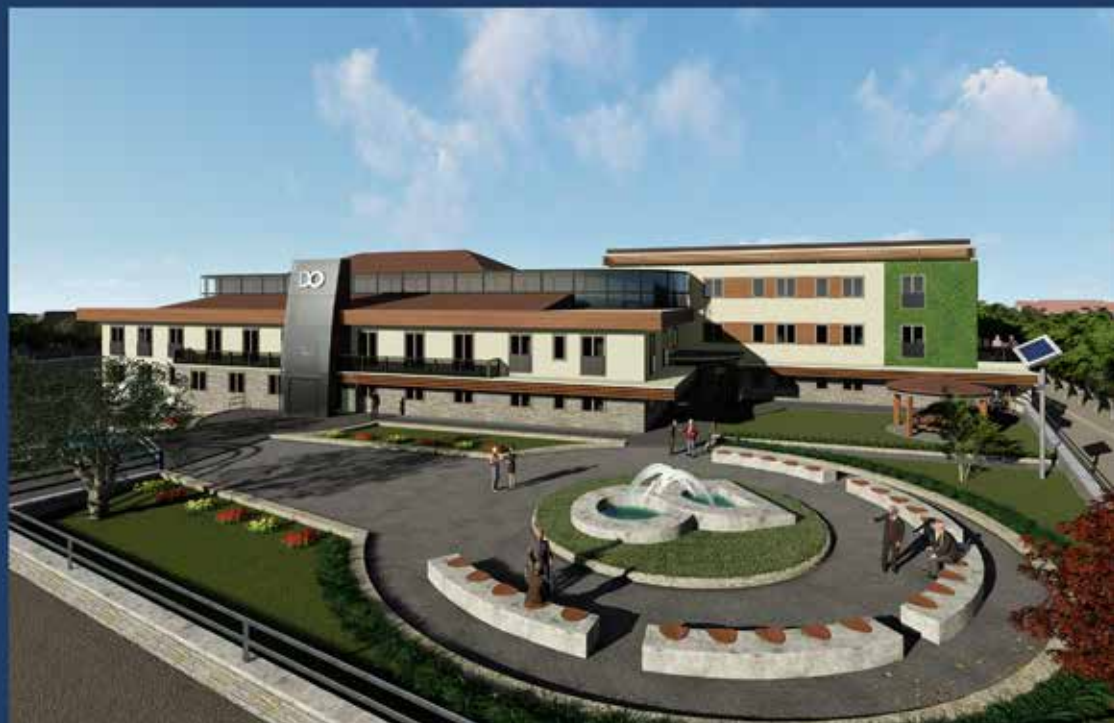
Rendering del progetto di ristrutturazione del complesso edilizio attualmente in corso.

Convegno organizzato dal CMS 'Don Orione' di Savignano Irpino